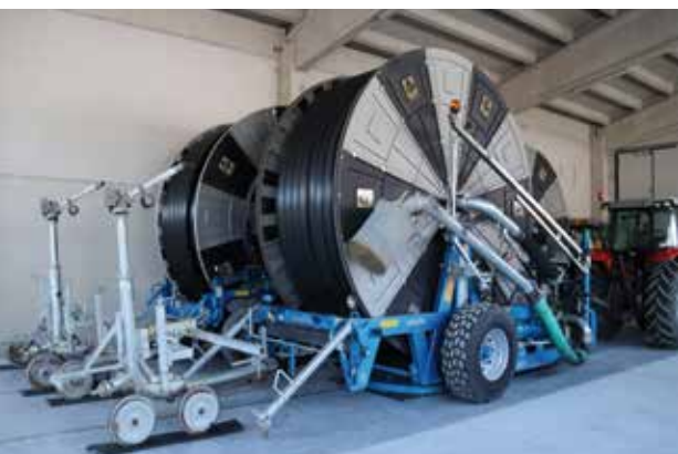
A sinistra: i rotoloni Casella utilizzati per l'irrigazione e la fertirrigazione

info@casella.it tecnico@casella.it www.casella.it