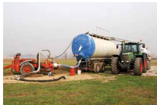
A destra: in mancanza dell'impianto sotterraneo, è possibile distribuire il refluo preventivamente stoccato in una "balia". Questa cisterna (al centro della foto, in blu e grigio) va parcheggiata nelle immediate vicinanze della strada, per poter essere agevolmente alimentata dai carri botte